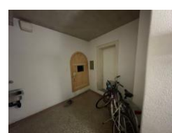
Rez de chaussée