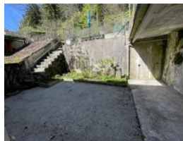
Terrasse (2 portes fenêtre, cuisine et chambre 1)