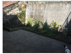
Terrasse (2 portes fenêtre, cuisine et chambre 1)