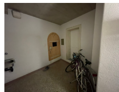
Rez de chaussée